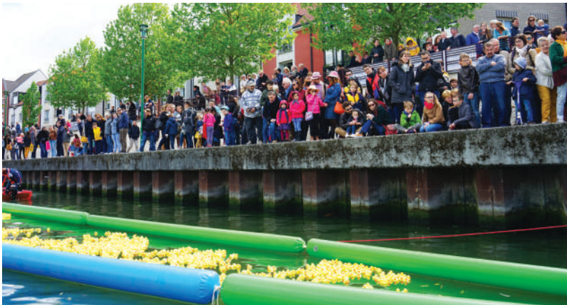
La 1 ère Duck Race madeleinoise a été organisée en mai dernier en partenariat avec le Rotary Club. La vente de 3 251 canards a permis de récolter 5 100 € au profit de la Fondation Alzheimer.

Depuis des siècles, les Français se réunissent pour, ensemble, mettre en place des projets, solidaires ou en faveur de l'intérêt général. Aujourd'hui, on estime à 1,3 millions le nombre d'associations actives en France.