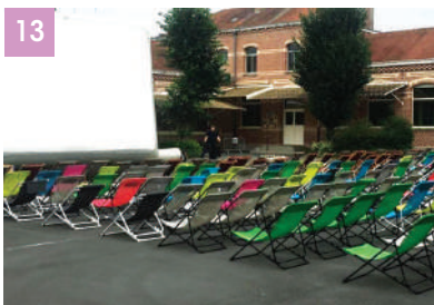
13 Une ch'tite séance sous les étoiles ! «La Ch'tite famille» a été projetée dans la cour de l'école Ros-tand à plus de 120 courageux qui ont affronté la fraîcheur de cette soirée d'été avec le rire !